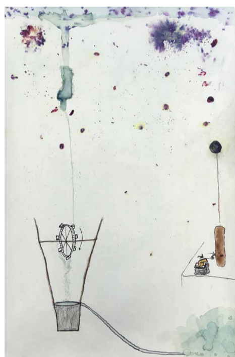
Pierre Berthet, dessin préparatoire pour une installation